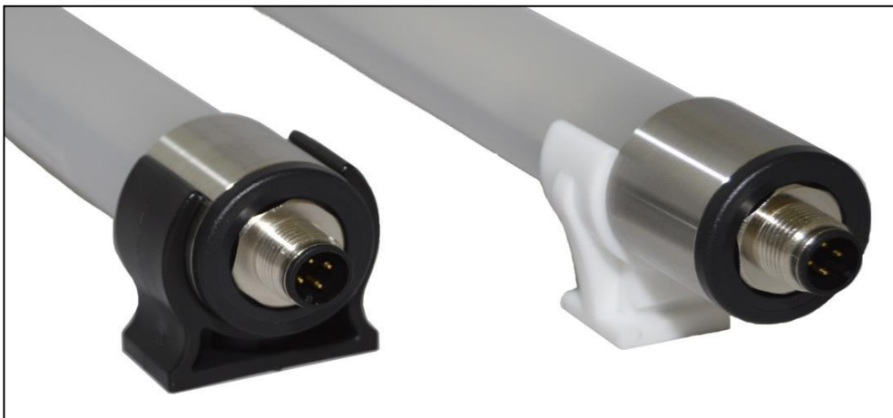
Montagebeispiele sample for mounting